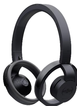
帝国軍モデル（ダークグレイ）