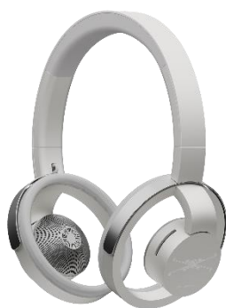
反乱軍モデル（ライトグレイ）

nwm ONE のカラーリングに『スター・ウォーズ』の世界観における「光と闇」の構図を重ね合わせ、ライトグレイは自由と希望を象徴する反乱軍モデル、ダークグレイは秩序と力を象徴する帝国軍モデルとして設計。二つの対照的なカラーは、物語の中で繰り返される「選択」と「バランス」というテーマをプロダクトに落とし込み、まるであなた自身が、そのどちらの意志に共鳴するかを選ぶかのような体験を提供します。