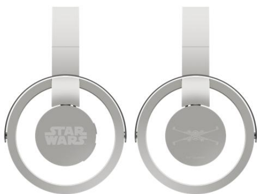
L：STAR WARS ロゴ R：X ウイング

のよう。シチュエーションを問わず利用しやすいよう、ミニマルデザインをキープしました。