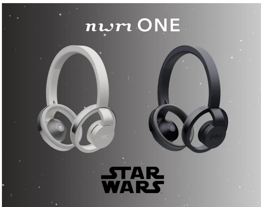
nwm ONE Star Wars edition

NTT ソノリティ株式会社（本社：東京都新宿区、代表取締役社長：坂井 博、以下「NTT ソノリティ」）は、没入ではなく“共存（Co-being）”をコンセプトとする NTT グループ初の音響ブランド「nwm（ヌーム）」より、オープンイヤー型オーバーヘッド耳スピーカー「nwm ONE（ヌーム ワン）」の『スター・ウォーズ』デザインの限定モデル「nwm ONE Star Wars edition」を nwm 公式ストア限定で発売いたします。2025 年 5 月 1 日(木)より先行予約受付開始、2025 年 5 月 28 日（水）より発売開始いたします。また、発売を記念して、世界最大級のポップカルチャーイベント「大阪コミックコンベンション 2025（略称：大阪コミコン 2025）」に出展いたします。