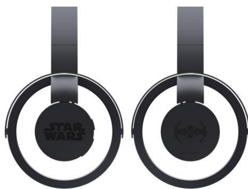
L：STAR WARS ロゴ R：TIE ファイター